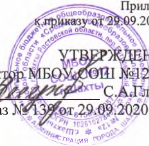
ГРАФИК ВЫДАЧИ МОЛОКА обучающимся 1-4 классов МБОУ СОШ №12 г.Шахты