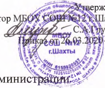
График дежурства педагогических сотрудников и администрации МБОУ СОШ №12 г.Шахты